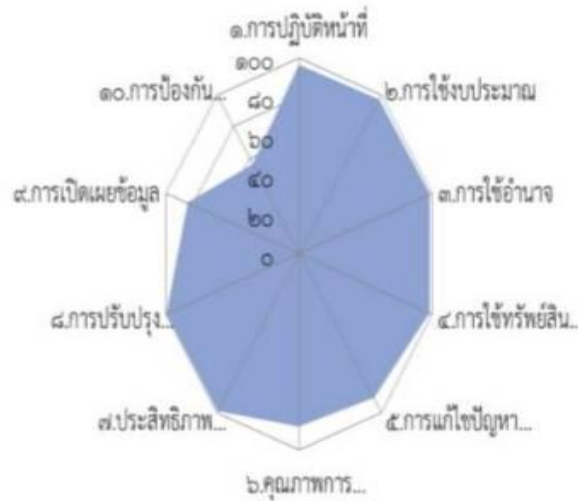
แผนภาพที่ ๒ ผลการประเมินจำแนกรายละเอียดตามตัวชี้วัด

๒. การวิเคราะห์ข้อมูลผลการประเมิน ITA ไปสู่การปรับปรุงแก้ไขการดำเนินงาน ปีงบประมาณ ๒๕๖๖ จากผลการประเมินคุณธรรมและความโปร่งใสในการดำเนินงานของโรงเรียนบ้านหนองหลุม ประจำปีงบประมาณ ๒๕๖๕ เป็นรายตัวชี้วัด มีผลการวิเคราะห์ข้อมูลในแต่ละตัวชี้วัดที่แสดงให้เห็นถึงจุดแข็งและจุด ที่ต้องพัฒนาไว้ ดังต่อไปนี้